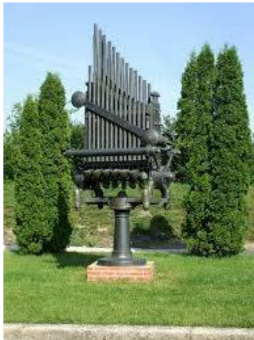
A víziorgona szobra

Ilyen hangszerből mindössze egy-két db maradt meg a világon.