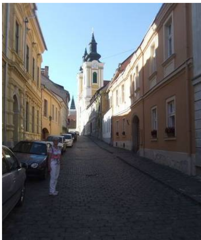
Középkori hangulatot idéző utcácskákon haladunk a Megyeháza felé.