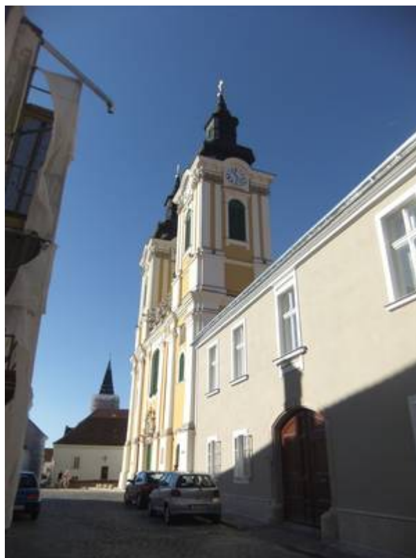
Toronyóra gyűjteményt rejt magában a Szent István székesegyház tornya.