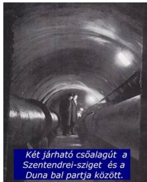
Két járható csőalagút a Szentendrei-sziget és a Duna bal partja között.