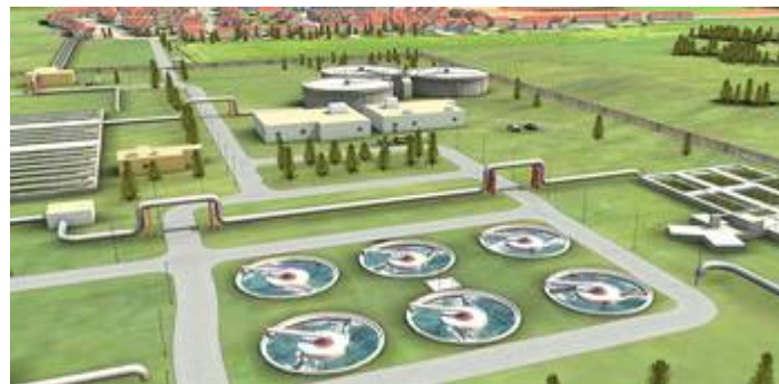
Egy szennyvíztisztító telep modellje

A két világháború között a megyei jogú városok közül csak Eger és Kaposvár rendelkezett korszerű biológiai tisztóművel.