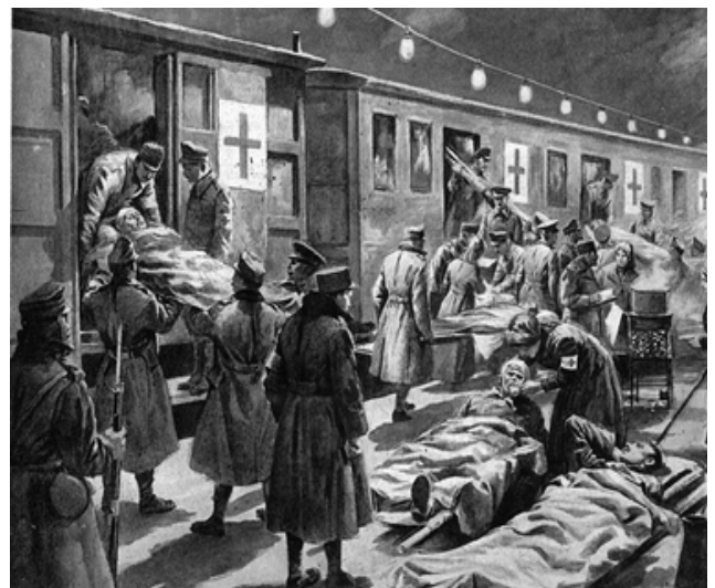
A frontról hazatérő katonák a pályaudvarokon