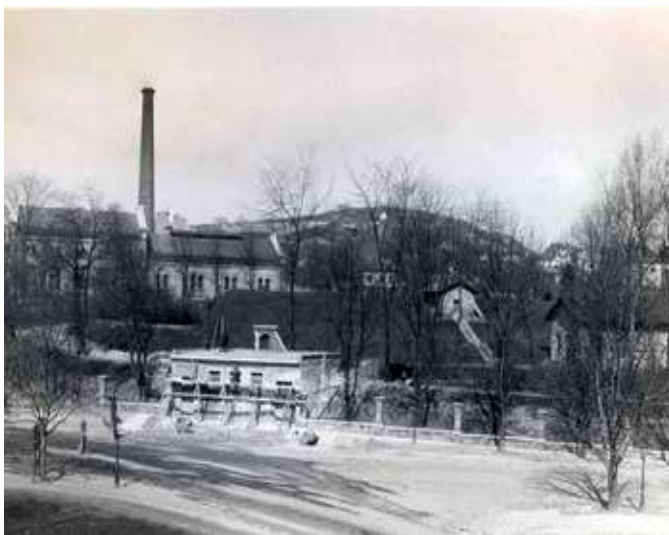
A krisztinavárosi vízmű telep első gőzüzemű gépháza és medencéi

Vízmű kutak a budaújlaki Duna-parton (Budapest, III. Árpád fejedelem útja)