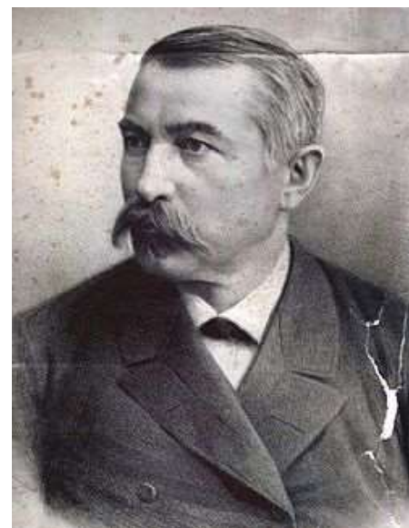
Wein János (1829–1908) az első budapesti vízműigazgató

A budai hegyvidéket hat ellátási övezetre osztotta. Ezek ellátását átemelő gépházak és víztároló medencék létesítésével tervezte megoldani.