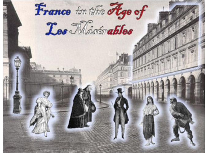
Ilyen lett Párizs a nagy átépítés után